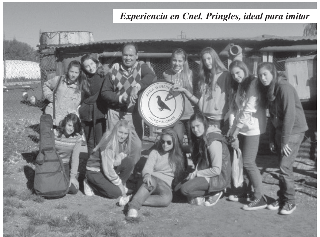
Experiencia en Cnel. Pringles, ideal para imitar

Sobran ejemplos, aislados por cierto, de proyectos ejecutados con éxito. Tanto en el exterior, como en nuestro medio. Países como Portugal, Francia, Holanda, Rumania, Estados Unidos, llevan a cabo programas de promoción, apuntando a chicos y grandes. En Argentina, experiencias como las de palomares en escuelas -como el caso vigente del instrumentado en la Escuela Agrotécnica de Coronel Pringles-, presencia social en clubes, exposiciones, sueltas de pa-